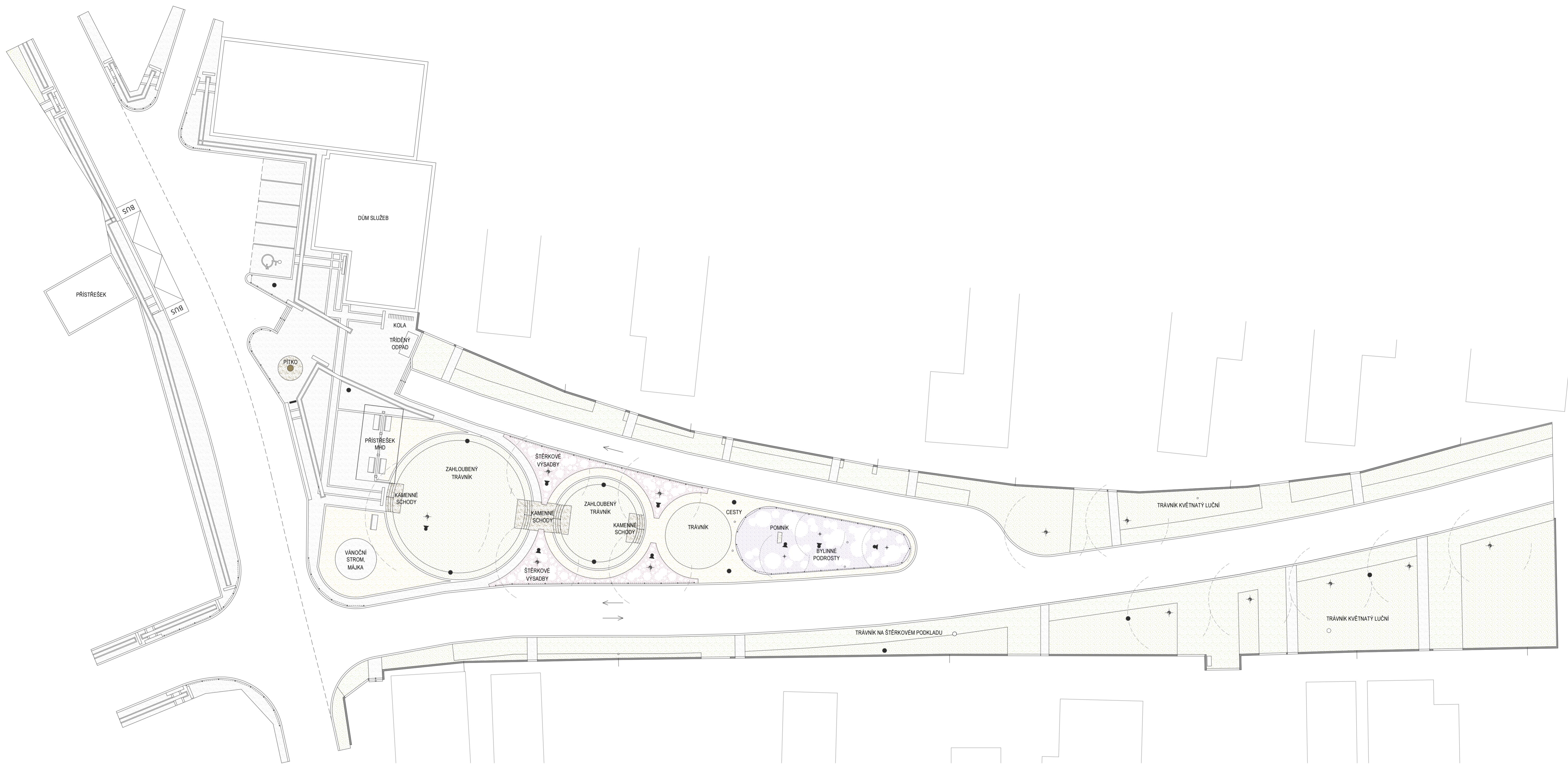
PŘEHLEDNÉ DIAGRAMY SITUACE