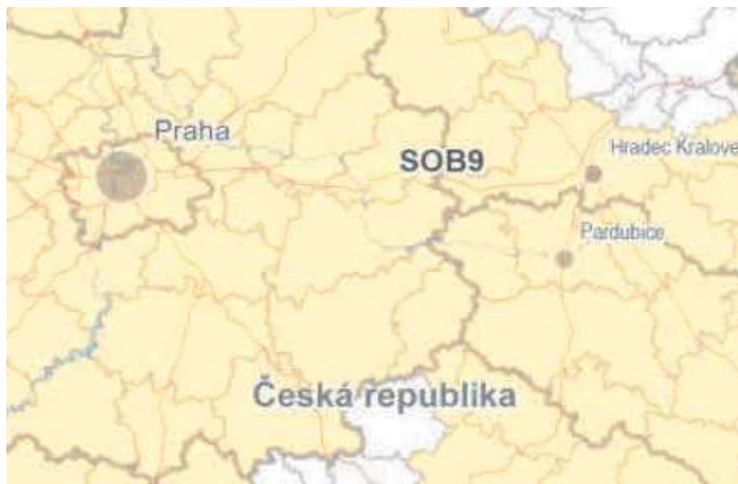
Obrázek 1: Výřez z výkresu Schéma 3 – Specifické oblasti

pro řešení problematiky sucha, zejm. tak jak je specifikováno výše v písm. a) až e) (příp. navrhovat i další vhodná opatření pro obnovu přirozeného vodního režimu v krajině) využívat zejména územní studie krajiny.