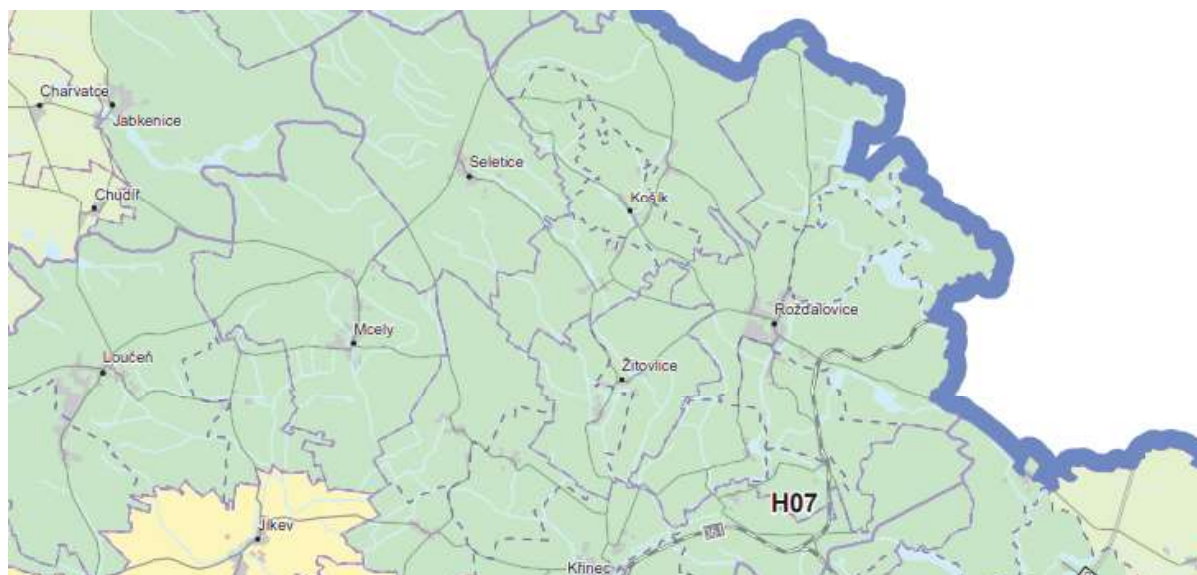
Obrázek 2: Výřez z výkresu Vymezení typu krajiny

d) chránit pohledový obraz místních kulturně historických dominant ve struktuře zástavby a ve vizuální scéně.